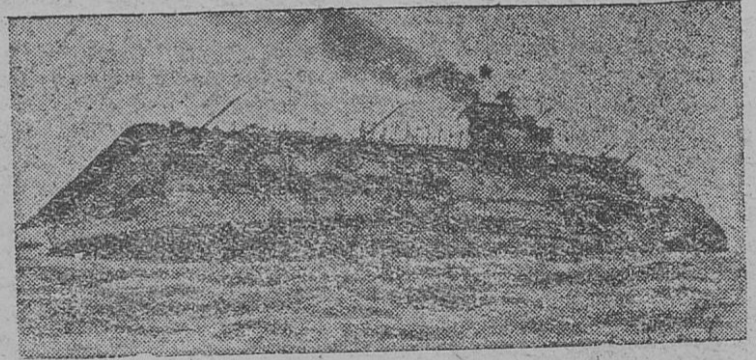
Гибель английского авианосца „Корейджис“ потоплен ного германской подводной лодкой.

Германская авиация, кроме поддержки наступающих войск, совершила разведывательные полеты над восточным и южным побережьем Англии.