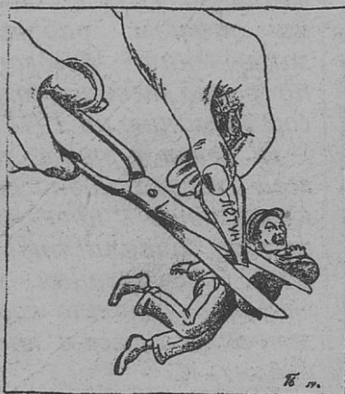
Храня от жуликов страну, подрежьте крылья летуну.