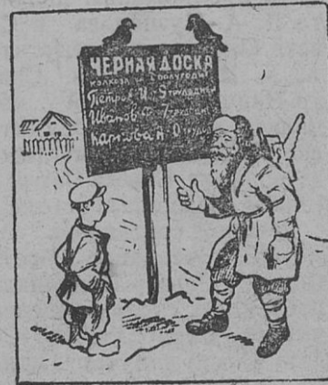
—Без очков не вижу; прсчитай, сынок, куда эта дорога. МАЛЬЧИК: —Конечно, из колхоза дедушка..