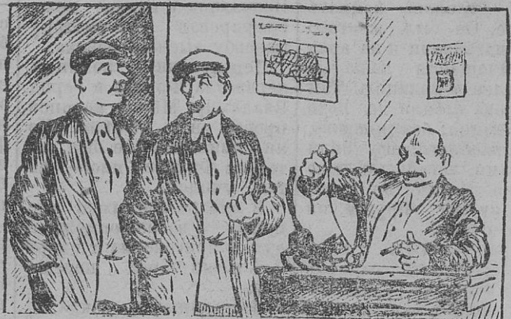
Смотри, сидит наш председатель — даром время тратит. — Нет, не даром, — он 150 рублей в месяц получает...

и интернаты, но даже и сельсовет. Финансовая смета за 3 квартал по сельсовету выполнена всего на 65 процентов, займу собрано на 40 процентов, Анучин несколько не интересуется жизнью и деятельностью колхозов, оторвался от общества, занялся своим личным хозяйством. В сельсовете бывает очень редко, а если и бывает, то толку в этом все равно мало — бездельничает.