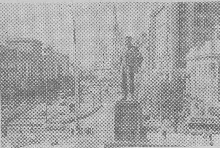
Москва сегодня. Площадь Маяковского.

Ответ: Спортсменам — успехов железногорцам — внимания к своим. Дружеская горячая поддержка — хорошее подспорье в достижении побед.