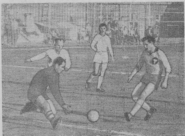
Железногорск — Киренск. Момент игры.