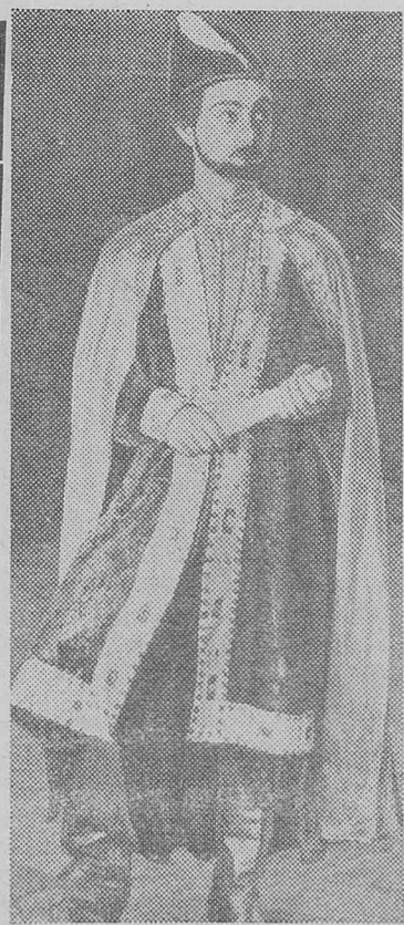
В начале сентября будет повсюду торжественно отмечаться 800-летие со дня рождения великого грузинского поэта и мыслителя Шота Руставели. Большая подготовка к юбилею идет в Грузии. Этой славной дате посвящают новые произведения поэты и прозаики, композиторы и скульпторы.