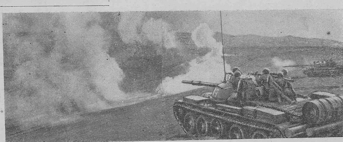
Танки подразделения офицера Г. С. Сименцова во время тактических занятий.