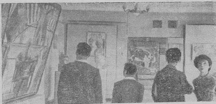
Барнаул. В залах музея изобразительного искусства открылась выставка работ молодых художников Алтая. В экспозиции — живопись, графика, скульптура.

Л. СЛАВИНА, кандидат педагогических наук