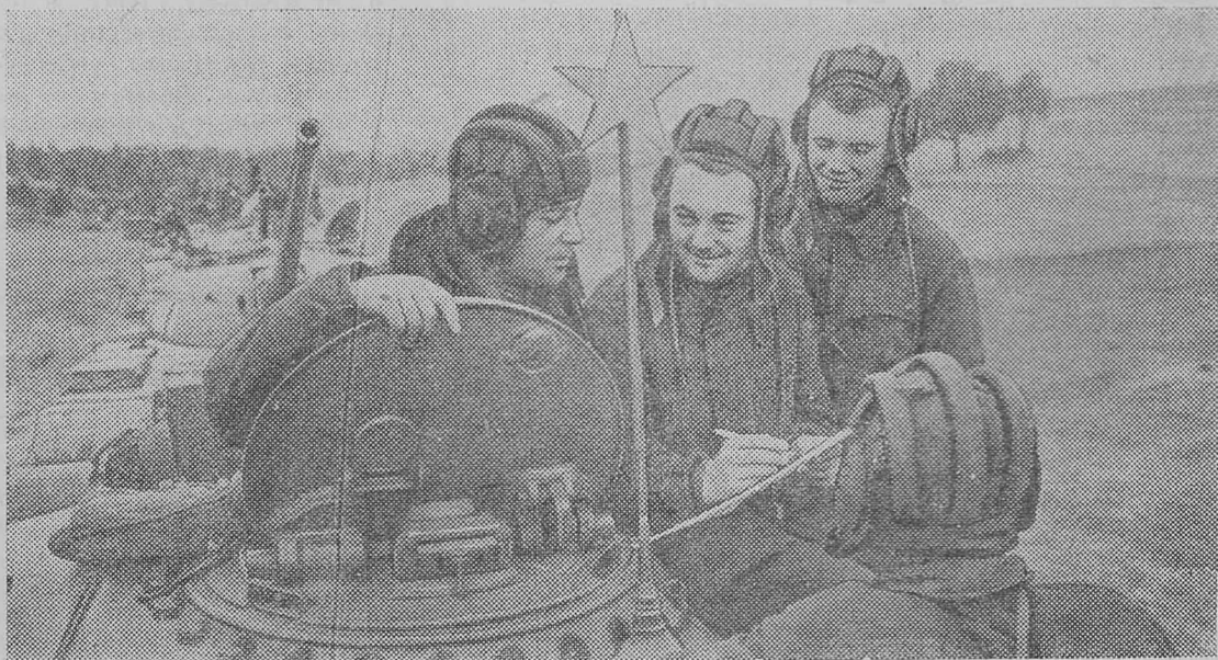
На учениях... Экипаж танка оказался первым. Об этом стоит рассказать в «Боевом листке».