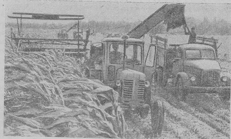
Убирают урожай труженики полей Тюменской области. Снимок сделан в одном из крупных хозяйств — совхозе «Урожайный».

Вы видите уборку кукурузы. Эта культура размещена на площади в 1.600 гектаров. С каждого из них сибиряки получают более 300 центнеров зеленой массы.