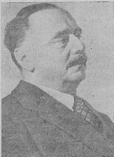
21 сентября исполнилось 100 лет со дня рождения выдающегося английского писателя-фантаста Герберта Уэллса (1866—1946), автора романов «Машина времени», «Человек-невидимка», «Борьба миров» и др.