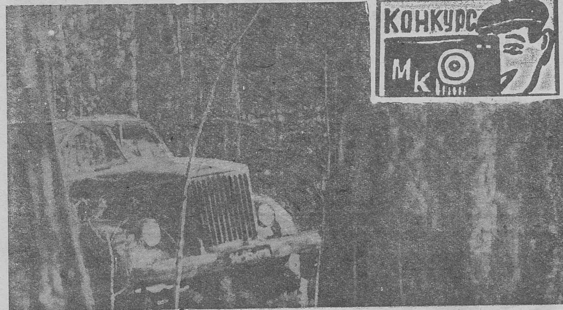
Фотоэтиюд В. Удовиченко.

В дальнейшем электрифи- каторы пойдут к берегам Ти- хого океана. За годы пяти- летки в Забайкалье предстоит электрифицировать тысячу километров железных дорог. (ТАСС)