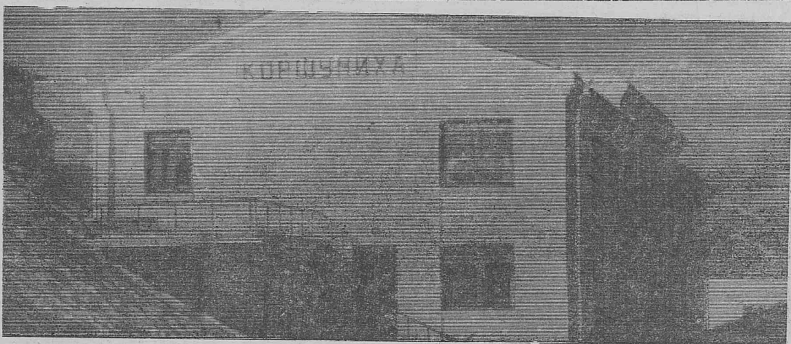
Наконец-то: «Ворота Коршунихи» — вокзал на днях сдан в эксплуатацию.

17 НОЯБРЯ В 6 ЧАСОВ ВЕЧЕРА СОСТОИТСЯ ОЧЕРЕДНОЕ ЗАНЯТИЕ ЛИТЕРАТУРНОГО ОБЪЕДИНЕНИЯ г. ЖЕЛЕЗНОГОРСКА. БУДУТ ОБСУЖДАТЬСЯ МАТЕРИАЛЫ ЖУРНАЛА «ТАЕЖНЫЙ РОДНИК».