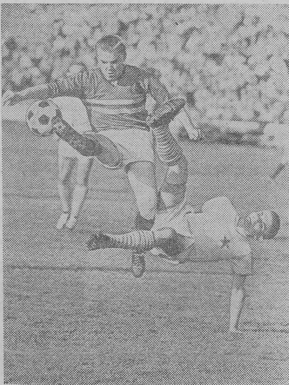
Из работ, поступивших на выставку «Интерпресс-фото 66». «Футбол». Ежи Будминский (Польша). Фотохроника ТАСС