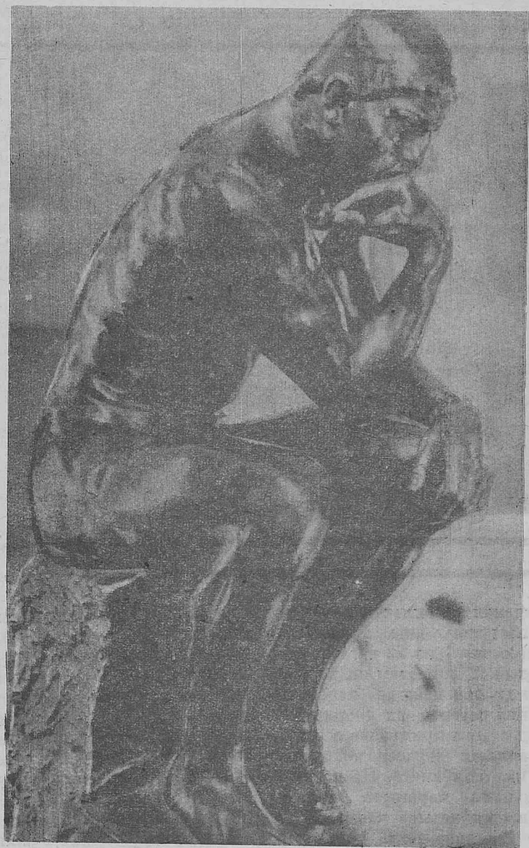
О. Роден. Мыслитель. На конкурс «МК».