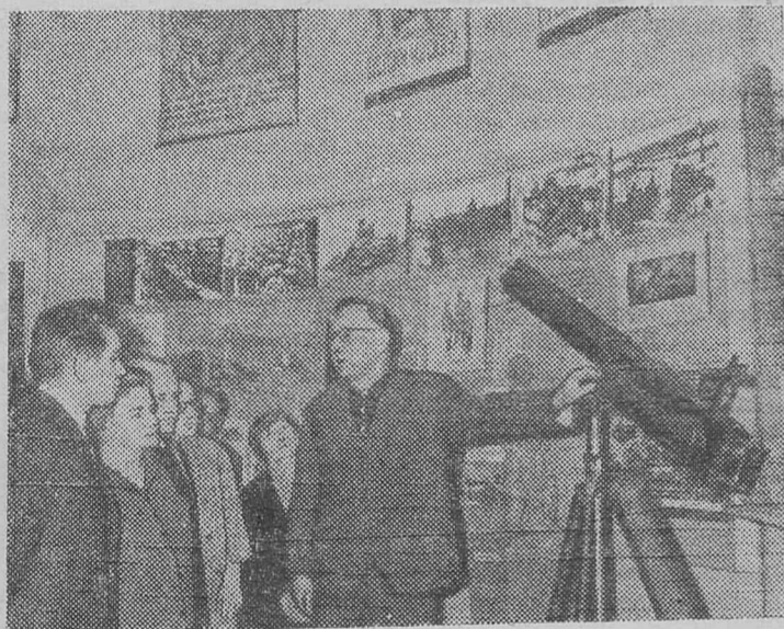
МОСКВА. В Государственном историческом музее открылась выставка, посвященная 25-летию разгрома немецких фашистов под Москвой.