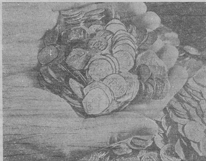
3 970 серебряных монет тринадцатого века нашей эры обнаружены недавно в Венгрии. Они были найдены недалеко от деревни Сигетчен (область

Пешт). находка, весящая 4 килограмма, в 1240 году представляла бы собой стоимость двухсот гектаров земли.