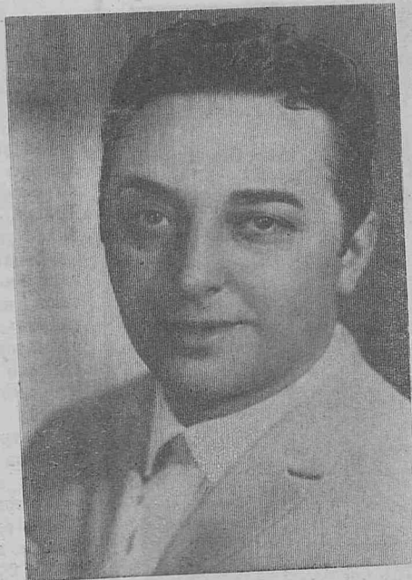
— До свидания! До следующей встречи на сибирской земле.

Заканчивается концерт. Но не хочется прощаться с артистами.