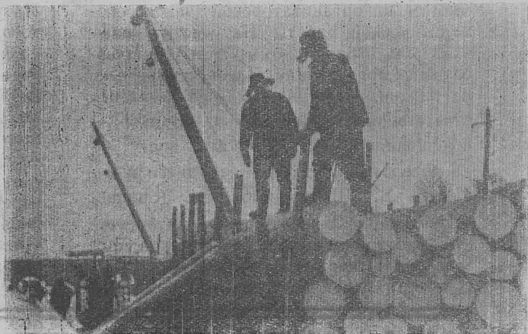
Погрузка в вагон.

...Венцом труда лесорубов считается отгрузка продукции. С этой