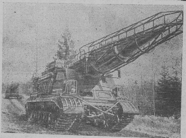
НА СНИМКЕ: ракетные установки на тактических занятиях.

РАЙВОЕНКОМ, ПАРТИЙНАЯ ОРГАНИЗАЦИЯ И КОМИТЕТ СОДЕЙСТВИЯ РАЙВОЕНКОМУ ГОРЯЧО ПОЗДРАВЛЯЮТ ВСЕХ УЧАСТНИКОВ ГРАЖДАНСКОЙ И ВЕЛИКОЙ ОТЕЧЕСТВЕННОЙ ВОЙНЫ, А ТАКЖЕ ВСЕХ БЫВШИХ ВОЕННОСЛУЖАЩИХ СОВЕТСКОЙ АРМИИ И ВОЕННО-МОРСКОГО ФЛОТА С ДНЕМ РОЖДЕНИЯ СОВЕТСКИХ ВООРУЖЕННЫХ СИЛ И ОТ ДУШИ ЖЕЛАЮТ ВСЕМ СЧАСТЬЯ В ЛИЧНОЙ ЖИЗНИ, КРЕПКОГО ЗДОРОВЬЯ, УСПЕХОВ В РАБОТЕ НА БЛАГО НАШЕЙ СОЦИАЛИСТИЧЕСКОЙ РОДИНЫ.