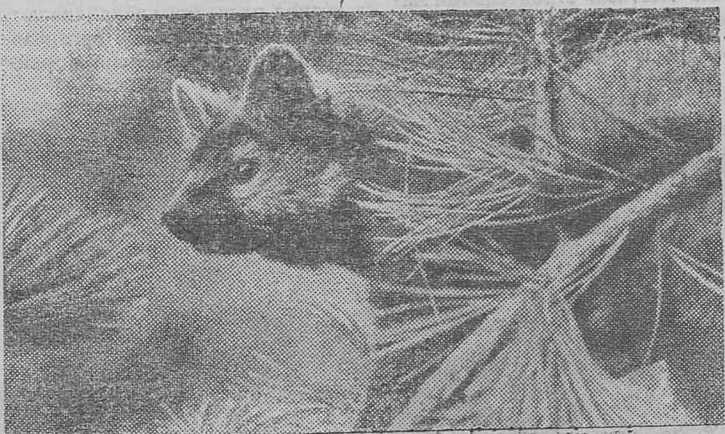
Вот он, соболя!

Хорошая добыча и у других охотников. Благодаря их труду Тункинский коопзверопромхоз по добыче пушнины вышел в число лучших в Бурятии. К открытию XXIII съезда партии коллектив охотников обязался выполнить две с половиной квартальные нормы.