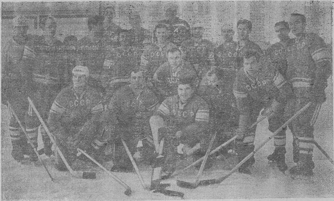
Чемпион мира — сборная команда СССР по хоккею.

Слева направо (первый ряд) — Виталий Давыдов, Владимир Брежнев, Виктор Коноваленко, Константин Локтев, Александр Альметов, Вячеслав Старшинов; (второй ряд) — Виктор Кузькин, Вениамин Александров, Александр Стриганов, Александр Рагулин, Виктор Полупанов, Виктор Зингер, Анатолий Ионов, Борис Майоров, Анатолий Фирсов, Владимир Юрзинов, Владимир Викулов, Игорь Ромишевский, Виктор Якушев, Олег Зайцев.