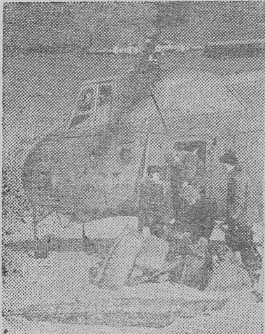
Вертолет доставил охотников коопзверопромхоза на один из гольцов Тункинских гор.