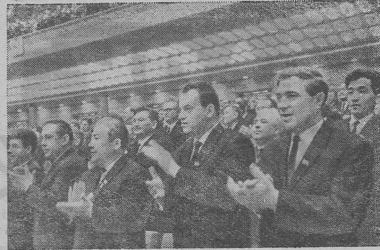
МОСКВА. XXIII съезд Коммунистической партии Советского Союза.

Пятилетка — это не только количественный рост нашей экономики, но и глубокие качественные сдвиги в ее структуре. В новом плане нашли отражение важнейшие тенденции современной научно-технической революции, выдающиеся открытия в области физики, химии, математики, кибернетики, биологии и других наук. Теоретическую основу пятилетнего плана, как и всей экономической политики советского государства, составляет марксистско-ленинская наука.