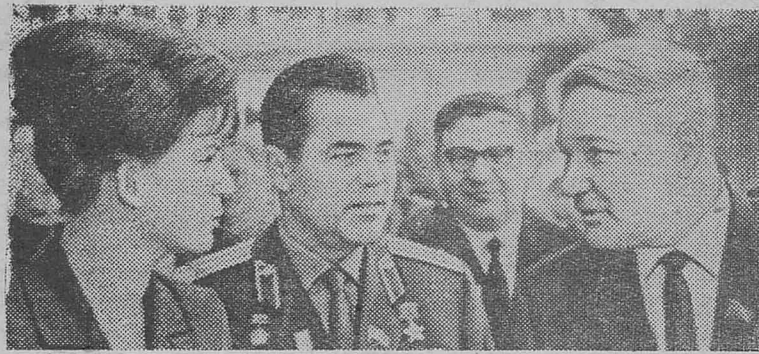
МОСКВА. XXIII съезд Коммунистической партии Советского Союза.

Орган Нижнеилимского районного комитета КПСС и районного Совета депутатов трудящихся Иркутской области