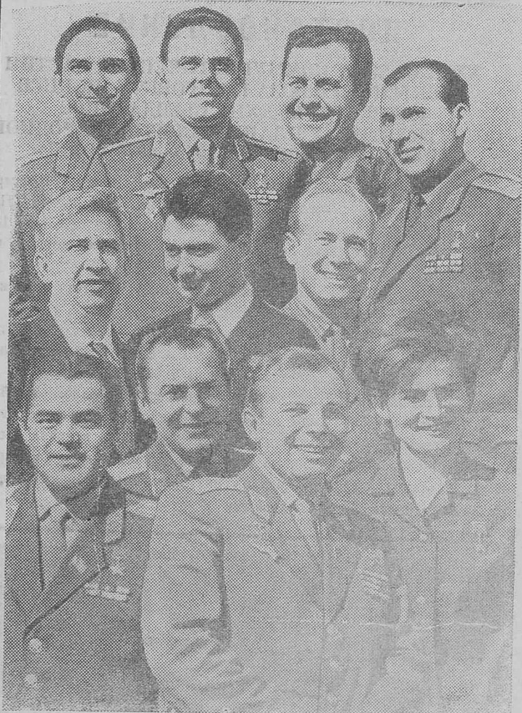
Вот они, герои, летчики-космонавты (слева направо) в первом ряду: А. Г. Николаев, Г. С. Титов, Ю. А. Гагарин, В. В. Николаева-Терешкова; во втором ряду: К. П. Феоктистов, Б. Б. Егоров, А. А. Леонов; в третьем ряду: В. Ф. Быковский, В. М. Комаров, П. Р. Попович, П. И. Беляев.

МОСКВА, 8 апреля состоялось заключительное заседание XXIII съезда КПСС. Председательствовал Л. И. Брежнев.