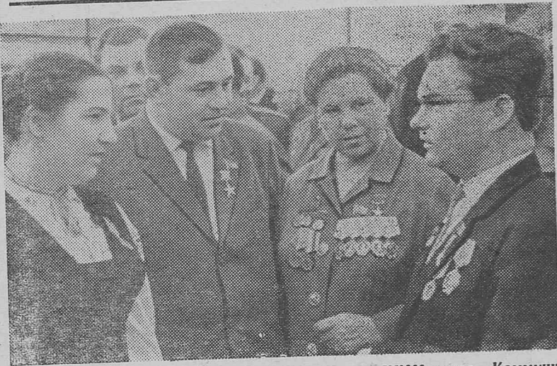
МОСКВА. Кремлевский Дворец съездов. XXIII съезд Коммунистической партии Советского Союза.

При разработке пятилетнего плана развития народного хозяйства СССР на 1966—1970 годы рассмотреть предложения, внесенные на партийных съездах в республиках и конференциях в краях и областях, на собраниях первичных партийных организаций и на собраниях трудящихся, а также предложения, внесенные рабочими, колхозниками, специалистами и учеными.