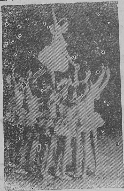
Смотр художественной самодеятельности. Танцуют школьники Илимска.