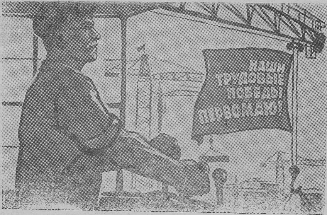
Плакат издательства «Советский художник».