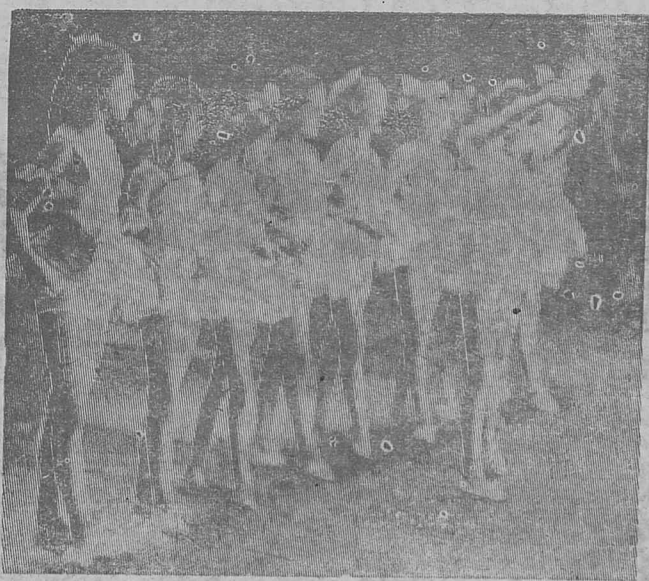
Юные балерины Илимска.