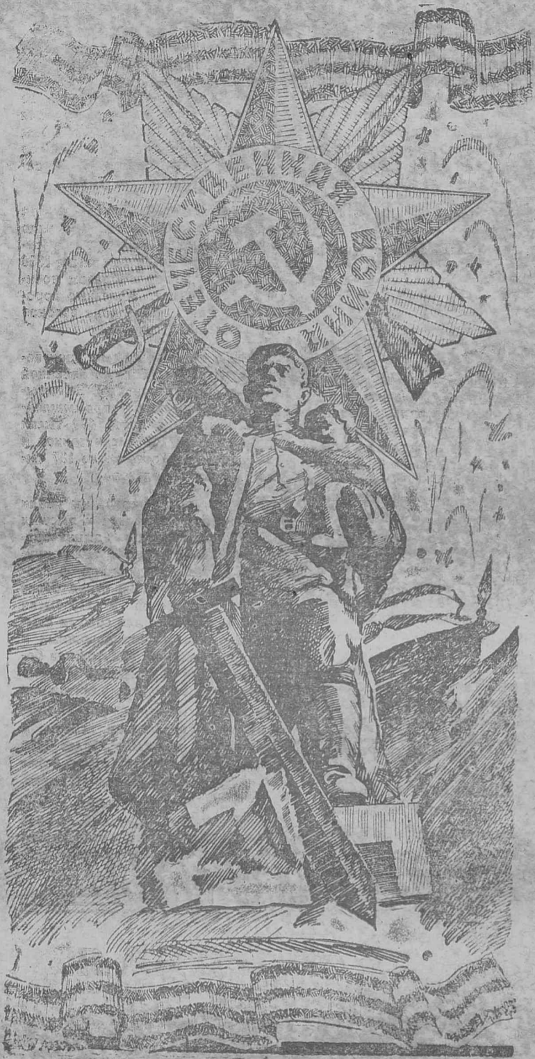
Плакат И. Полярного.