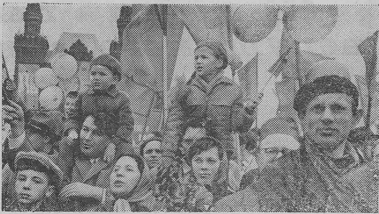
МОСКВА. Демонстрация представителей трудящихся на Красной площади 1 Мая 1966 года.