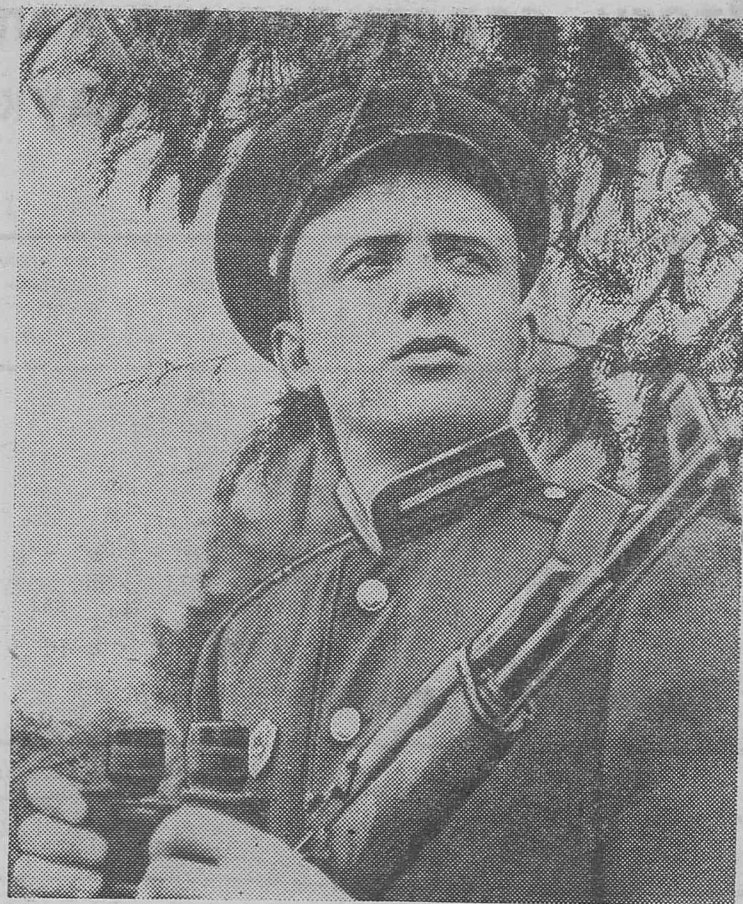
Бдительно несет службу на границе воин в зеленой фуражке.

Фильм направлен против мещанства, которое неуязвимо в лобовой атаке, так как ни шашкой, ни пулей его не возьмешь. Для того, чтобы бороться с мещанством, люди, как в атаке, должны чувствовать локоть друг друга. Это жестокая борьба.