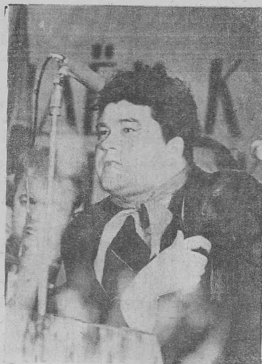
Недавно в Братске состоялся слет молодых строителей Сибири.

Для нужд страны из района вывозится много древесины. Большинство первичных партийных организаций леспромхозов, развернув социалистическое соревнование, добились хороших результатов. План четырех месяцев по валовой продукции леспромхозами района выполнен на 104 процента,