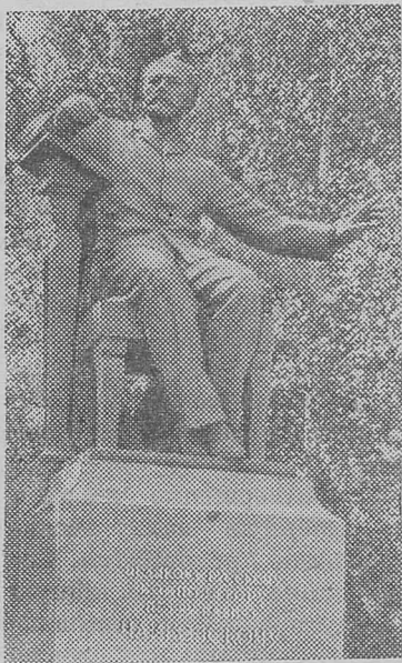
В Москве открылся Международный конкурс скрипачей, пианистов, виолончелистов и певцов имени П. И. Чайковского.

На снимке: памятник П. И. Чайковскому работы скульптора В. И. Мухиной у здания Московской государственной консерватории.