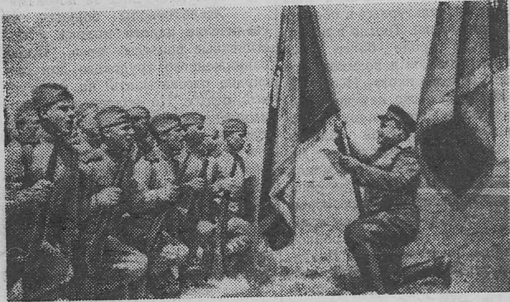
На снимке: воины у боевого знамени дают клятву биться с врагом до полной победы.

Тот не забудет никогда. Он не забудет, не забудет Атаки яростные те У незнакомого поселка, На безымянной высоте... Мне, как бывшему командиру