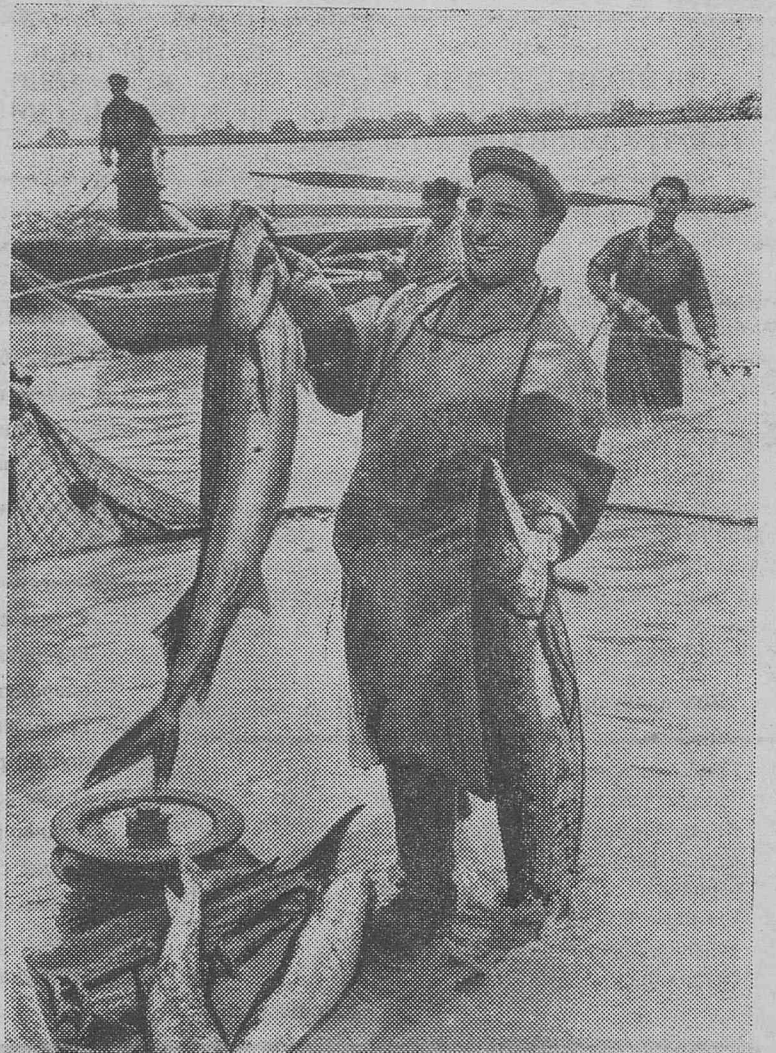
С хорошим уловом!