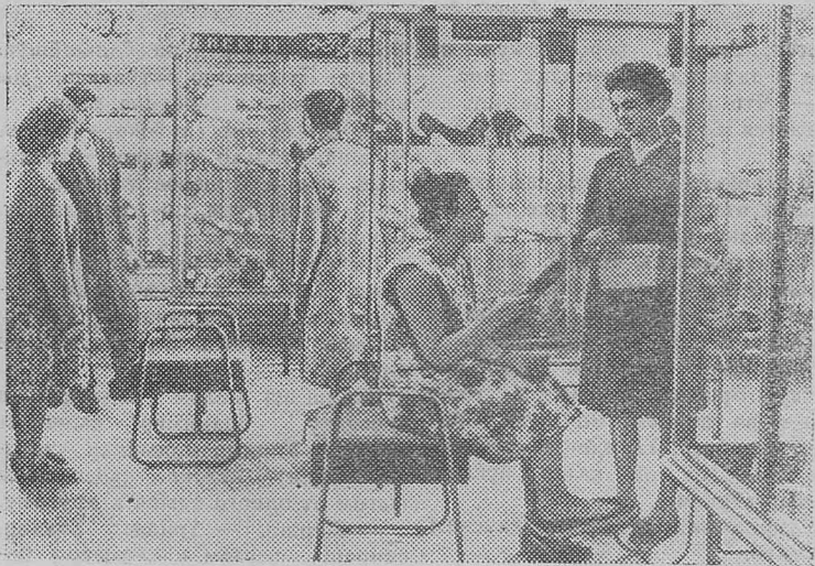
В Омской области ведется большое строительство магазинов. Новые здания не отличаются от городских. На снимке: в отделе женской обуви в Калачинском универсаме.