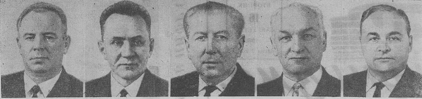
Н. В. Подгорный