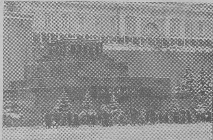
МОСКВА. Красная площадь. У Мавзолея В. И. Ленина. Январь 1966 года.