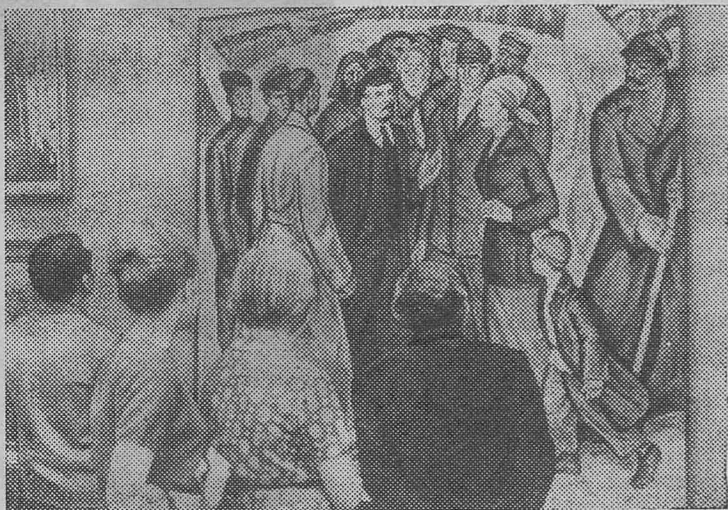
«Художники Москвы — 50-летию Октября» — так называется выставка, открывшаяся в Москве. НА СНИМКЕ: у картины М. Никонова «Ленин с народом».

Коллектив фабрики в честь 50-летия Великой Октябрьской социалистической революции обязался выдать сверх плана 50 тысяч тонн концентрата. К выполнению этого обязательства и стремится сейчас наша партийная организация. Коммунисты фабрики уверены, что слово свое коллектив сдержит. Сверхплановый концентрат будет нашим подарком предстоящему празднику. В. ДМИТРИЕВ, секретарь партийной организации обогатительной фабрики.