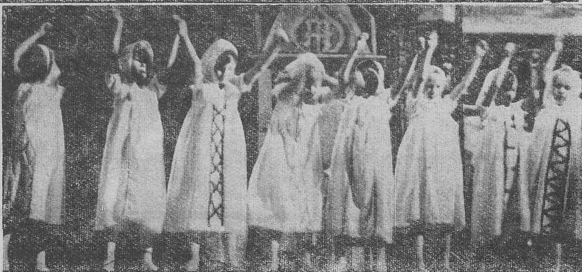
Фото и текст А. Гончарова.

После поздравлений состоялся концерт-постановка по мотивам сказки А. С. Пушкина «Сказка о золотой рыбке».