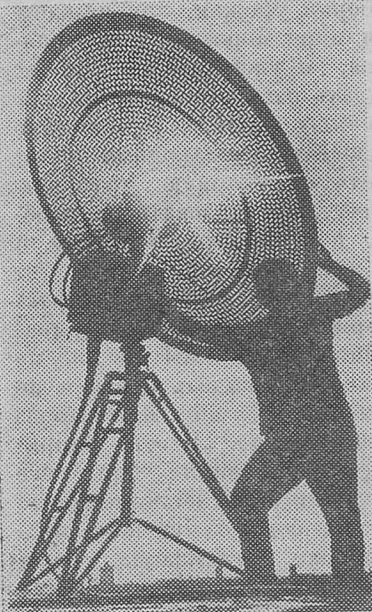
Эта фотография Н. Ключева «К далекому миру» (Узбекская ССР) — одна из работ, поступивших на Всесоюзную юбилейную выставку «50 лет Великого Октября в художественной и документальной фотографии», которая откроется в сентябре на Выставке достижений народного хозяйства СССР.