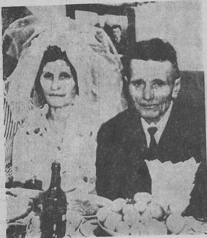
Фото автора. д. Зырянова.

На снимке: супруги Перетолчины. К. ВАСИЛЬЕВ.