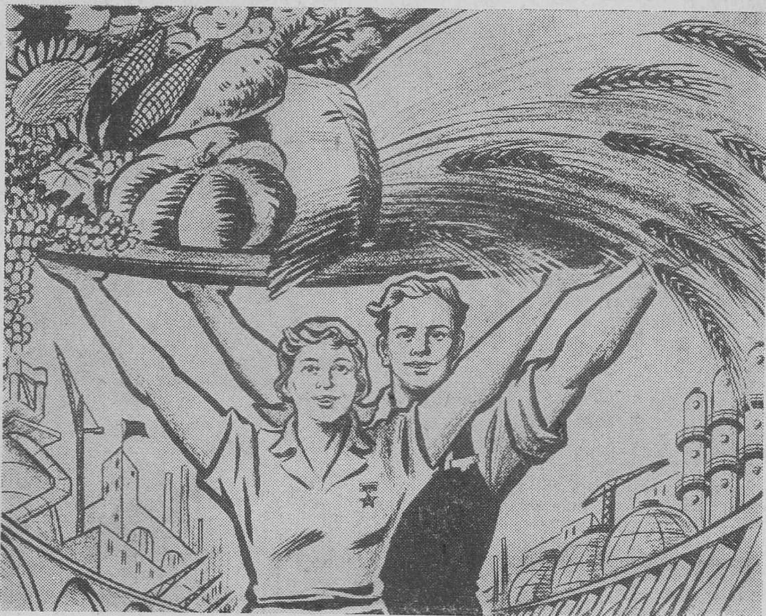
Плакат Ю. Иванова.