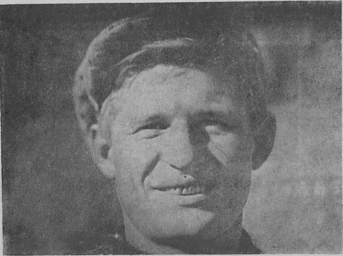
Портрет нашего современника