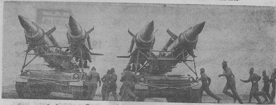
Сигнал учебной тревоги. Ракетчики быстро и четко занимают свои места.

24 ноября 1967 года в Доме культуры в 18.00 часов состоится отчетно-выборное партийное собрание Коршуновстроя. Регистрация коммунистов начнется в 17 часов 30 минут. Партком.