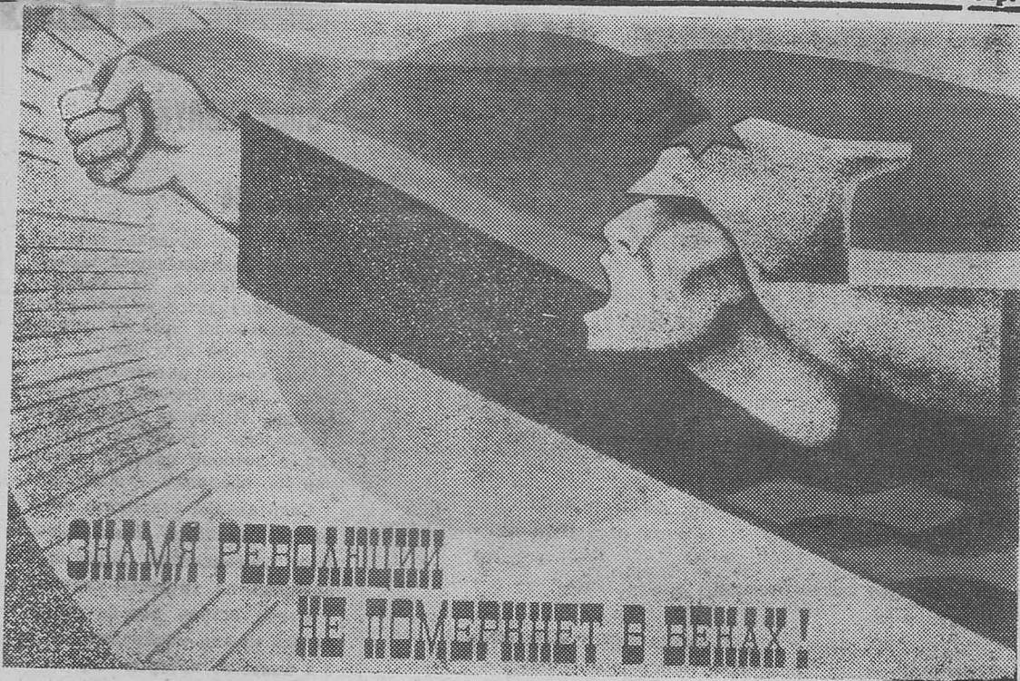
Плакат, выпущенный издательством «Советский художник» к 50-летию Советской власти.