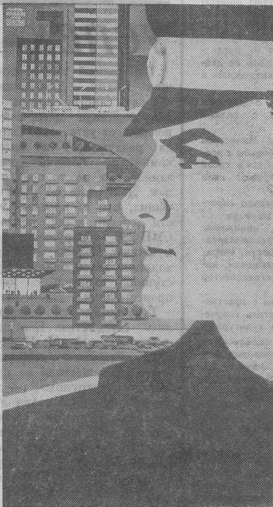
Ежегодно в нашей стране как большой всенародный праздник отмечается День советской ми-