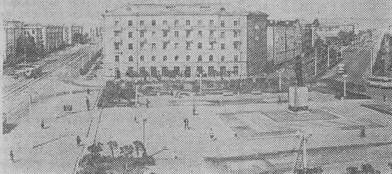
Сегодняшний Кomsomolsk-on-Amur — современный город с двухсоттысячным населением. На снимке: вид на площадь имени В. И. Ленина.