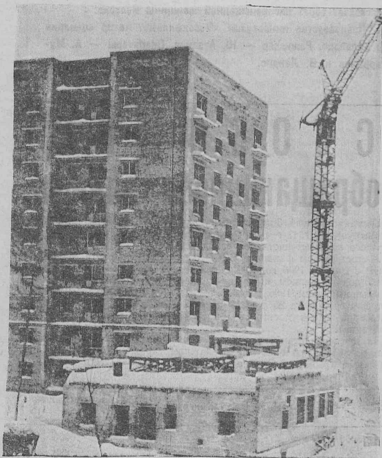
Первый девятиэтажный дом Железногорска. Он находится в третьем микрорайоне.