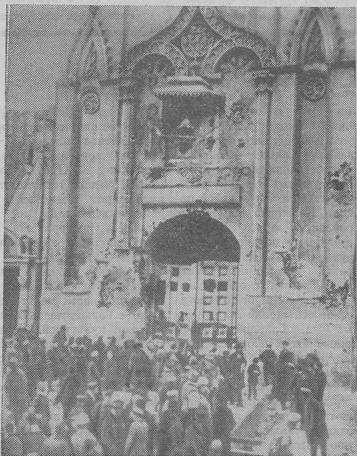
Ноябрь 1917 года. Кремль взят. У Никольских ворот.

После пятидневного кровавого боя враги народа, поднявшие руку против революции, разбиты наголову. Они сдались и обезоружены. Ценою крови мужественных борцов — солдат и рабочих была достигнута победа. В Москве отныне утверждается народная власть — власть Советов, рабочих и солдатских депутатов».