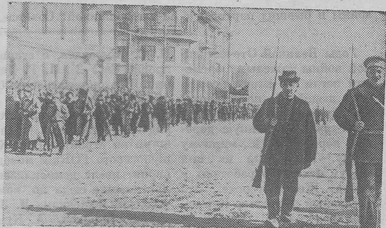
Чита. 1917 год. Красная гвардия.

Организовать Советскую власть в г. Иркутске, отстранить агентов Временного правительства Керенского и подчинив Советской власти все местные правительственные учреждения».