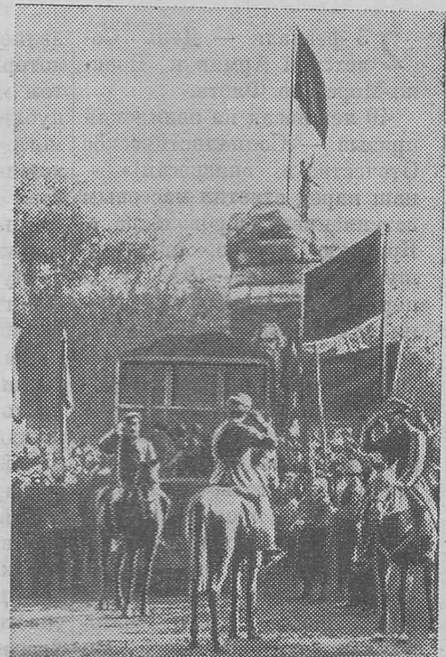
Поднятие Красного знамени в честь провозглашения Советской власти в Ташкенте.

Почти полвека прошло с той поры, когда Ленин, выступая 25 октября (7 ноября) 1917 года с докладом о задачах власти Советов на заседании Петроградского Совета, сказал: «Отныне наступает новая полоса в истории России, и данная, третья русская революция должна в своем конечном итоге привести к победе социализма». Пророческие слова вождя революции сбылись. Завершив построение социализма, советский народ, руководимый партией Ленина, возводит сейчас светлое здание коммунизма.