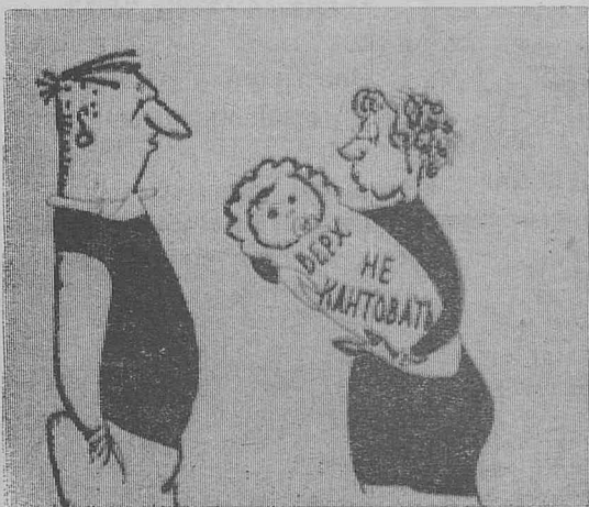
Рисунок В. Воеводина. СУПРУГИ

— Посидишь сегодня один, я тебе все расписала.