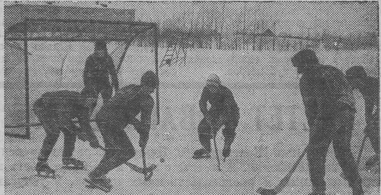
АЛТАЙСКИЙ КРАЙ, Павловский район. Команда совхоза «Комсомольский» по хоккею с мячом успешно выступает в районных соревнованиях. Она, например, завоевала Кубок открытия зимнего сезона.