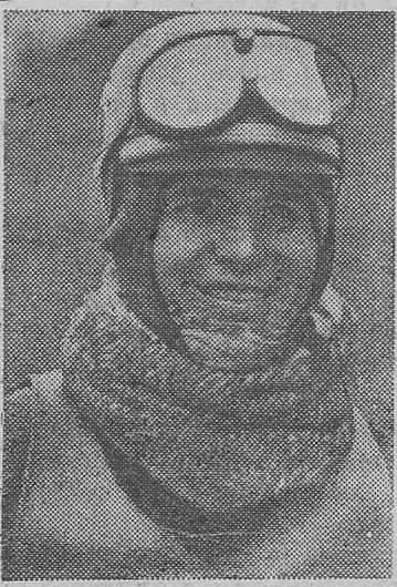
В Красноярске закончились соревнования первенства Советского Союза по мотогопкам на льду в классе машин 175 кубических сантиметров. 16 сильнейших спортсменов оспаривали звание чемпиона СССР 1967 года.