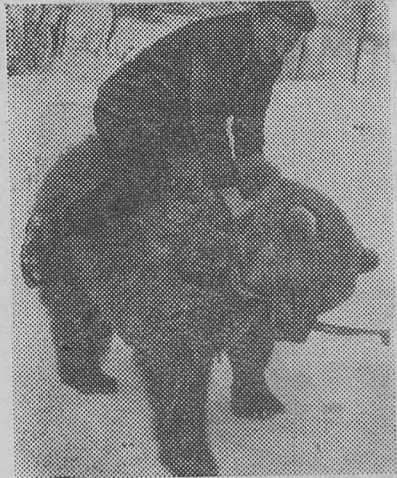
Этот снимок сделан в таежной геологической партии на далекой Камчатке. С медведем Рэмом искатели более двух лет связывают узы вза-

имной привязанности и дружбы. Совсем маленьким медвежонком сопровождал Рэм вместе с ездовыми собаками геологические отряды. После работы, на снежной поляне, возле жилища Рэма часто устраиваются веселые игры, проводятся целые матчи вольной борьбы. Чудо дрессировки показывают геологи, буровики, водители вездеходов. Крепкие люди живут на Крайнем Севере, а у богатырей и забавы богатырские.