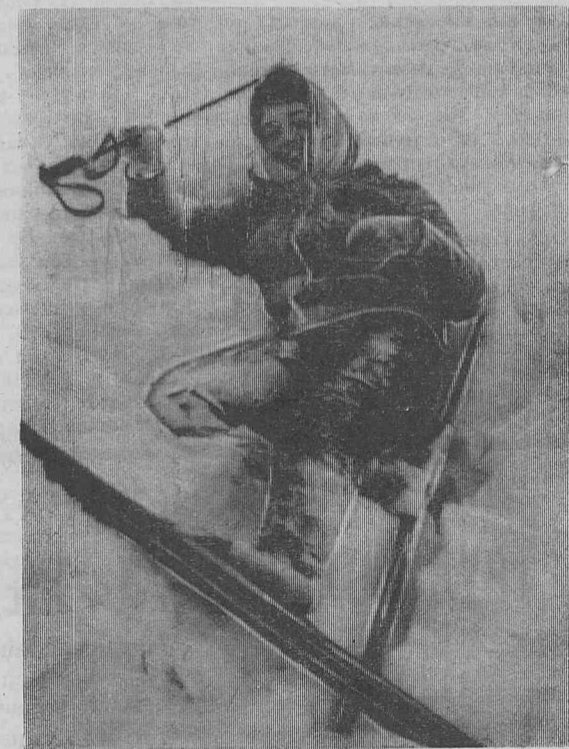
На снимке: «Бывает и так».