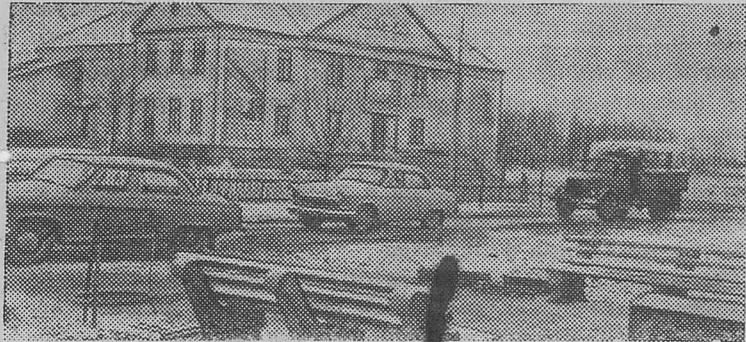
ДОНЕЦКАЯ ОБЛАСТЬ. Готовясь достойно встретить 50-летие Советской власти, сельские труженики Волновахского района совместно с представителями шефских промышленных предприятий разработали двухлетний план строительства дорог, клубов, кино-театров, школ, больниц, предприятий торговли и общественного питания. Сооружения ведутся на центральных усадьбах колхозов и совхозов, объединяющих несколько населенных пунктов. На снимке: Дом культуры колхоза «Россия» — новостройка села Златоустовка.

Орган Нижнеилимского районного комитета КПСС и районного Совета депутатов трудящихся Иркутской области