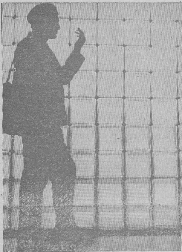
Репортер. На конкурсе «МК».