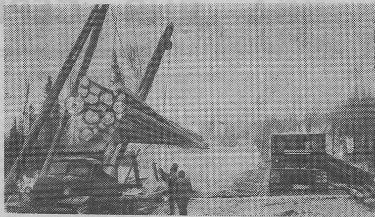
На снимке: погрузка древесины на лесоучастке Усть-Нарык лес-промхоза «Терсинский» (Кемеровская область).