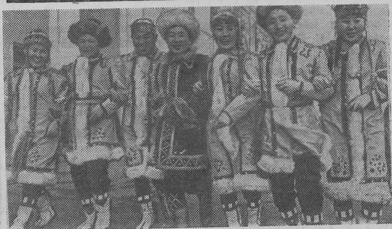
Идет по российской земле большой праздник народного искусства. На сценах крупнейших городов показывают свое мастерство лучшие самодеятельные коллективы.