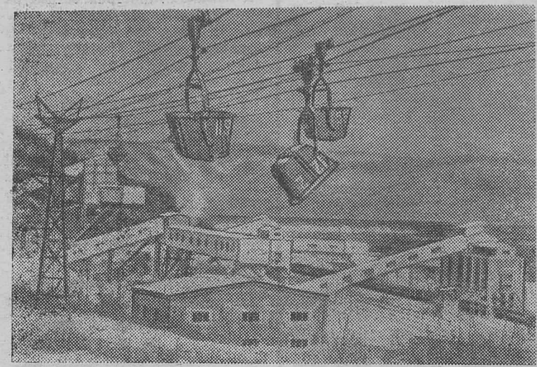
Мраморный рудник «Перевал» вблизи байкальских берегов в ущелье Восточных Саян. По этой подвесной дороге мрамор с «подоблачных» высот, где гремят взрывы, доставляют на дробильную фабрику.

Продолжается подписка на нашу газету. Цена годовой — 2 р. 28 к. полугодовой — 1 р. 14 к.