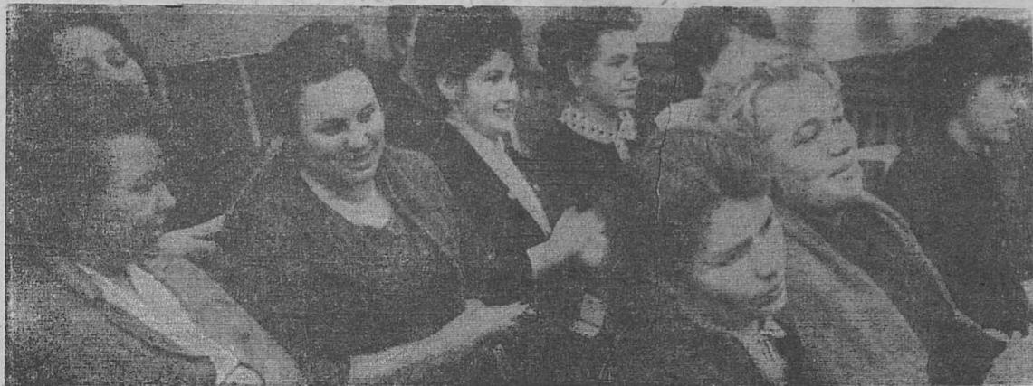
В зале заседаний слета.